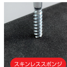
スキンレススポンジ