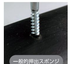
一般的押出スポンジ